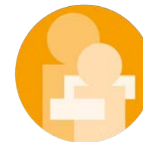
MS-Zentrum nach den Vergabekriterien der DMSG, Bundesverband e.V.

Unter Ausnutzung aller strukturellen, technischen und fachlichen Möglichkeiten unseres Krankenhauses bieten wir Ihnen Medizin aus einer Hand an einem Ort und hoffen, dass Sie sich bei uns gut aufgehoben fühlen.